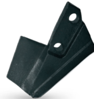
RFU050600D0 Bota Solá derecha