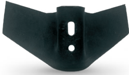
R1510B80000 Cultivador - Chisel