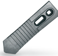
RRASTRU4070 Reja rastrojera universal