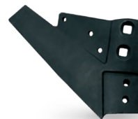
RADAPGILR91 Porta-punta Milagroso derecha