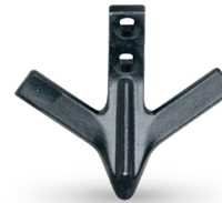
RRAJ01F0000 Modelo especial