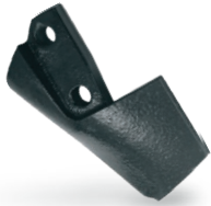
RFU05060010 Bota Solá izquierda