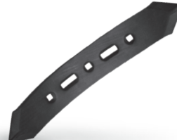
RTWISTIB000 Chisel Rastrojero izda.