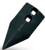
PADAPGILP91 Punta Milagroso derecha