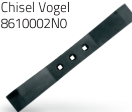
RU8610002N0 Chisel Vogel 8610002N0