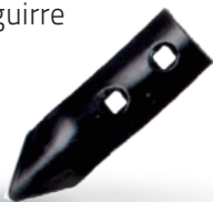
RR29BB00000 Sembradora adaptable a Aguirre