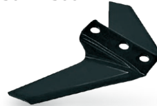
RKK301123R0 Adaptable a Kverneland 30112300