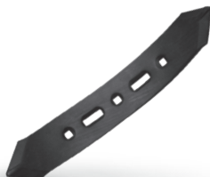
RTWISTDB000 Chisel Rastrojero dcha.