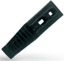
R2808030SPW Chisel Horsch Terrano