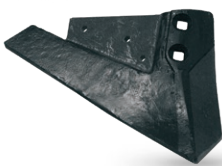
RR19CNDFF000 Vernete derecho