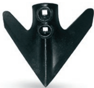
R513A2CN8F0 Golondrina 2N 285