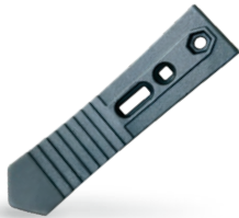
RRASTRULBDE Rastrojera universal