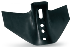
ARAV0080070 Adaptable Vogel Terramix CV008007H