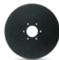
KUHN METASA YD065701 - 16"