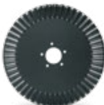
KUHN 110014 - 17"