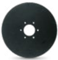
KUHN METASA YD065702 - 15,5"