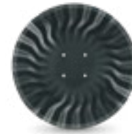
THUNDER 18" (4 Ø 98)