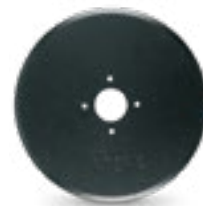
KUHN 110034 - 16"