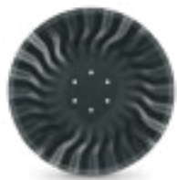
THUNDER 18" (6 Ø 100)