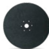
KUHN N00875A0 Máxima